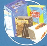
PETITS EMBALLAGES EN CARTON