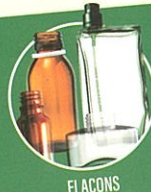
FLACONS EN VERRE