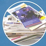
JOURNAUX, CATALOGUES, PROSPECTUS