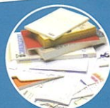
CAHIERS, BLOC-NOTES, IMPRESSIONS, COURRIERS, ENVELOPPES, LIVRES